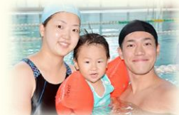
ベビースイミング